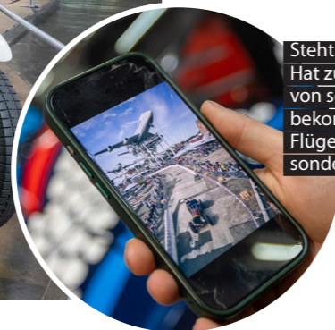
Steht auf Vorkrieg. Hat zum 15. ein Model T von seinem Onkel bekommen. Findet, ein Flügeltürer ist kein Oldtimer, sondern ein Reiseauto.