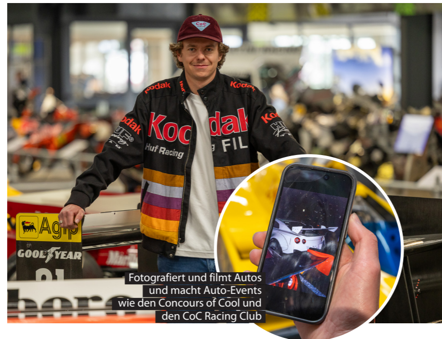
Fotografiert und filmt Autos und macht Auto-Events wie den Concours of Cool und den CoC Racing Club

„Mein Wunsch an die Oldtimer-Szene? Dass man mit den Autos lockerer umgeht. Dass man halt mal macht, worauf man Lust hat.“