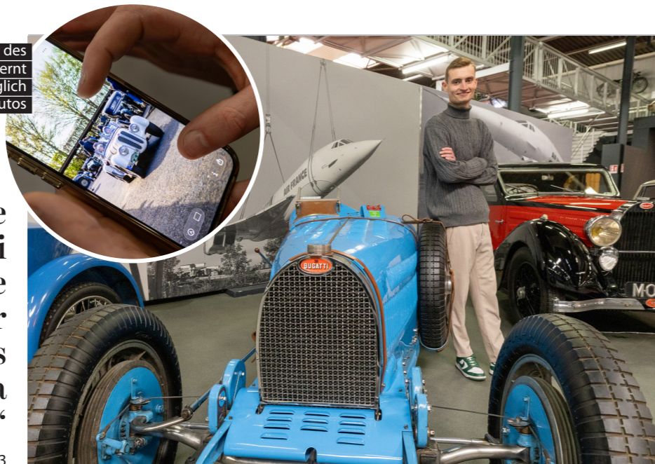
Hat in der Werkstatt des Vaters Mechatroniker gelernt und arbeitet täglich an alten und sehr alten Autos

„Für die Szene wünsche ich mir, dass man bei Veranstaltungen wie etwa den Rallyes mehr junge Leute trifft, dass mehr junge Leute da zusammenkommen.“